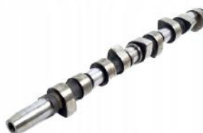
Распределительный вал FORD Connect 1.8TDCI90H/PDU/ Ford Focus I