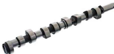
Распределительный вал Ford Fiesta/Escort/Mondeo 1.8D/TD 89-98 -