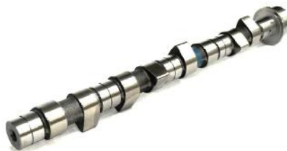
Распределительный вал Fiat Ducato 230/Daily/Mascott Sofim 2,5-2,8D/HDI/TD