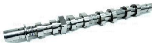
Распределительный вал выпуск Renault Megane II 1,6 16V K4M760/8..