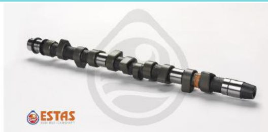
Распределительный вал VAG LT/TRANSPORTER 2.5TD mot.AAT/ABT/AEL/AGX/AXL/BBE/BJK/