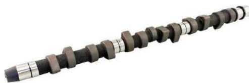
Распределительный вал VW LT28-35/40-55 2.4D DV/DW/ACL/ACT -96