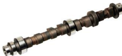
Распределительный вал Fiat Punto 188 / Palio 1,2 16V