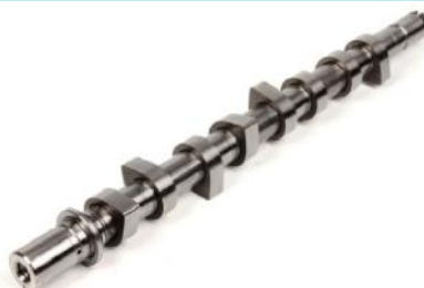
Распределительный вал Renault Kangoo/duster/megane II 1.5dci K9K700-796