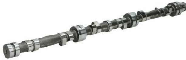
Распределительный вал BMW 5 (E28),5 (E34),6 (E24),7 (E23),7 (E32) M30 30-3,5