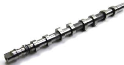
Распределительный вал впуск Renault Laguna/Master/Trafic 2.2dci/2,5 G9U