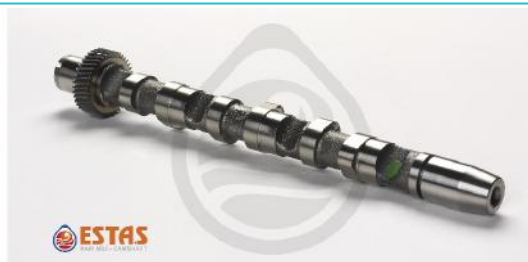
Распределительный вал впускной VAG 2.5TDI V6 AFB 97> 1/3