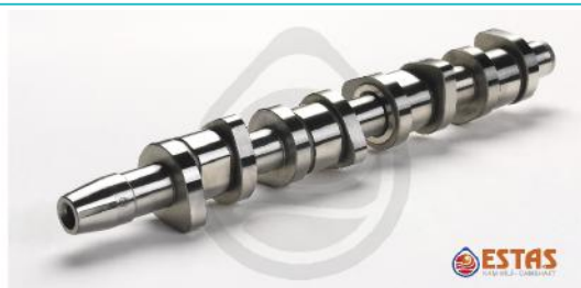
Распределительный вал VAG 1.9TDI-2.0TDI 16V BLS/BMT/BMP 05