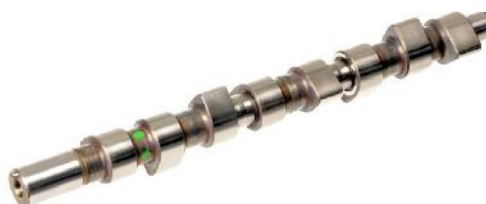
Распределительный вал Fiat Brava/Ducato/Tipo 1,9TD