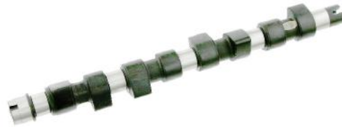
Распределительный вал Fiat Doblo 1.9 TD