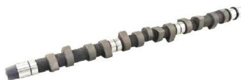
Распределительный вал VAG LT28 2.4D/TD DV/DW