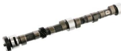
Распределительный вал FORD Escort IV 1,3 GAF