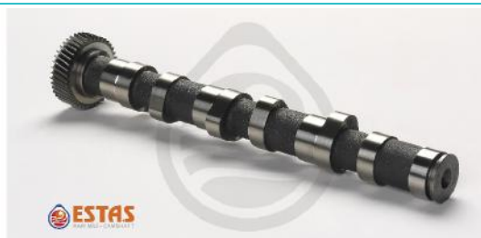
Распределительный вал выпускной VAG 2.5TD 97- AFB/AKN/AKE 1-3