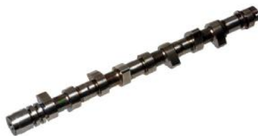
Распределительный вал PSA 309-405