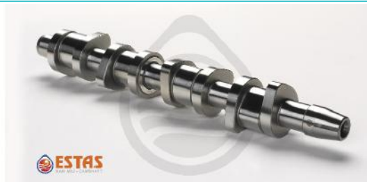
Распределительный вал VAG 1.9TDI AJM/ASZ/ATD/ATJ/AVB/AWX 95>