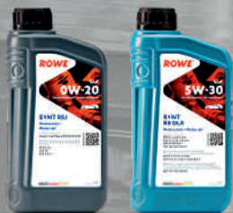
Моторные масла HIGHTEC SYNT RSJ SAE 0W-20, HIGHTEC SYNT RS DLS SAE 5W-30