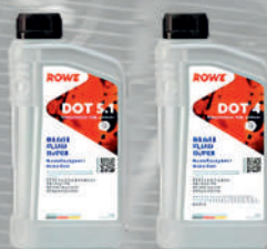
Тормозная жидкость HIGHTEC BRAKE FLUID SUPER DOT 5.1, HIGHTEC BRAKE FLUID SUPER DOT 4